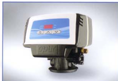
Valvola - Vanne