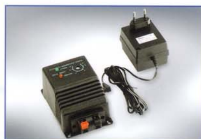
Dispositivo STERIL/EL - Dispositif STERIL/EL

Un dispositif électronique, STERIL/EL (D.M. 443 du 21.12.90), permet en outre la désinfection des résines durant les phases de régénération de la saumure, en maintenant toujours l'appareillage hygiéniquement sûr.