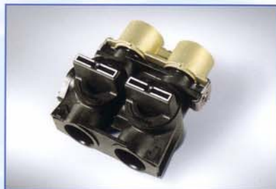
By-pass - By-pass