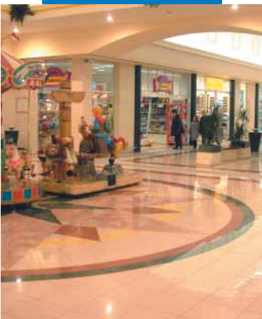
Esempio di posa di gres porcellanato - Centro Commerciale Zanchetta - Treviso