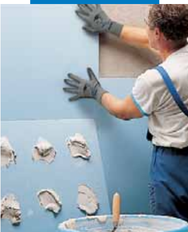
Posa di lastre di polistirolo con Keraflex bianco