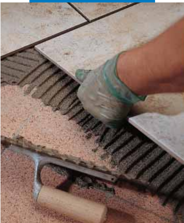
Sovrapposizione di un rivestimento in monocottura su marmette esistenti