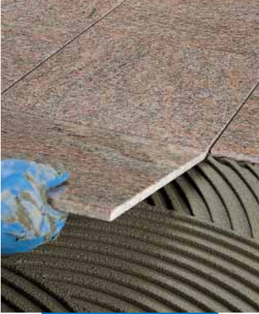
Posa di marmo prelevigato a pavimento

Nel caso di applicazione di lastre fonoassorbenti o isolanti, applicare Keraflex a cazzuola o a spatola a punti.