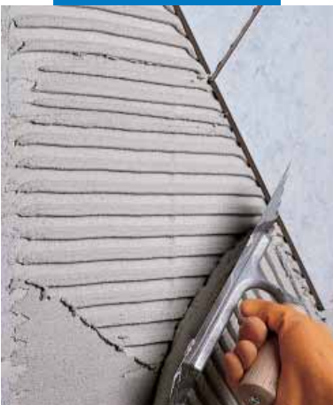
Posa di monocottura su parete in blocchi di cemento cellulare espanso