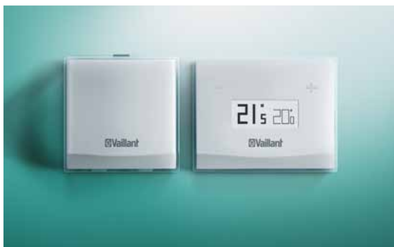
vSMART installata a parete e il suo dispositivo WiFi