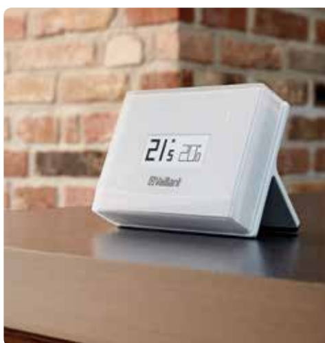
vSMART non installata a parete

vSMART trasforma il tuo smartphone o tablet in un sistema di controllo a distanza per il tuo riscaldamento. Ovunque tu sia e qualsiasi cosa tu stia facendo potrai controllare e regolare il comfort di casa in modo rapido ed estremamente intuitivo sfruttando la tua rete WiFi.