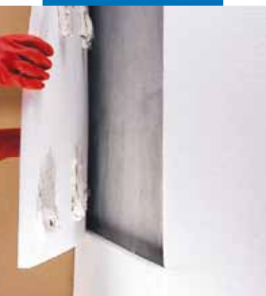
Incollaggio a punti di pannelli in materiale isolante