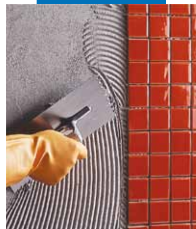
Posa a rivestimento di mosaico ceramico