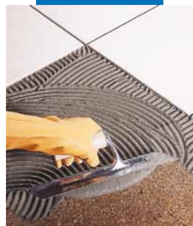
Posa a rivestimento di piastrelle in monocottura su sughero

N.B. I dati tecnici di Kerabond impastato con Isolastic sono riportati sulla scheda tecnica di quest'ultimo.