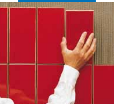
Posa a parete

Kerabond è irritante; contiene cemento, che a contatto con sudore o altri fluidi del corpo produce una reazione alcalina irritante e manifestazioni allergiche in soggetti predisposti. Usare guanti e occhiali protettivi. Evitare il contatto con gli occhi e la pelle. Per ulteriori e complete informazioni riguardo l'utilizzo sicuro del prodotto si raccomanda di consultare l'ultima versione della Scheda Dati Sicurezza.