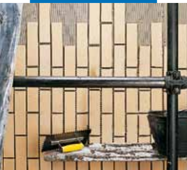
Posa a parete in esterno