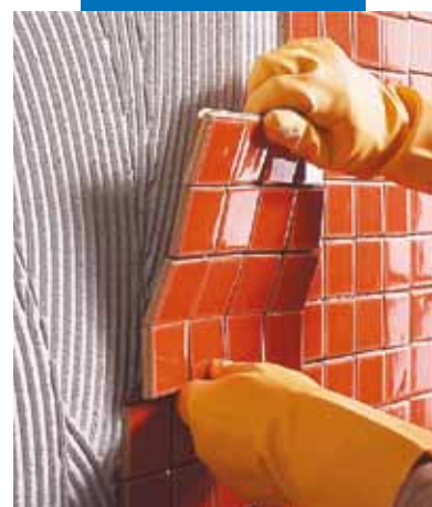
Posa a rivestimento di mosaico ceramico